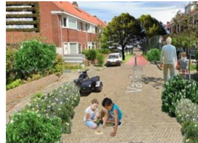
Figuur 2: detail uitwerking huidige woningen

De woongelegenheden in het Land van Cuijk zijn toe aan vernieuwing. In de toekomst worden nieuwe innovatieve 'hexagon' wijken aangelegd. In deze wijken is een menging van doelgroepen aanwezig en door een gedeelde binnentuin wordt de sociale cohesie in de wijken gestimuleerd. De oude wijken worden aan beide kanten doodlopend gemaakt. In het midden van de doodlopende wegen zal een BuurTuin zijn, die als park dient en de sociale cohesie bevordert. Door deze vernieuwingen is Land van Cuijk een voorbeeld voor de rest van Nederland.