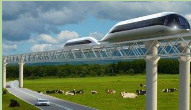
Figuur 1: detail uitwerking monorail

In het land van Cuijk worden de bewegingen met de auto verminderd om veiligheid en klimaatvriendelijk vervoer te stimuleren. Kleine dorpskernen zijn zoveel mogelijk autovrij om de sociale cohesie en levendigheid in de stad te verhogen. Transport van goederen en mensen tussen dorpskernen zal door middel van een monorail-netwerk en fietsstraten verbonden worden. Daarnaast wordt deelvervoer gestimuleerd met een grote beschikbaarheid aan (non-)elektrische leenfietsen.